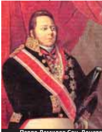
Павло Демидов Сан-Донато